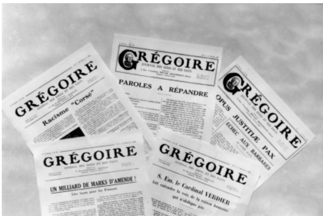
Les cinq numéros de « Grégoire »

Ma mère était traductrice en anglais et en allemand. Lorsque mes parents durent quitter leurs fonctions, en raison des ordonnances allemandes de 1941 interdisant aux Juifs la plupart des emplois, ils travaillèrent au service administratif des maisons d'enfants de l'UGIF.